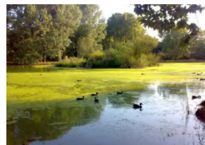
Bassa dels ànecs