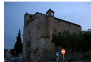
Església St Sadurní