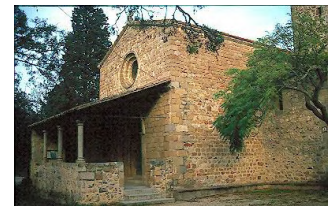
Ermita de Malanyanes