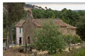
Ermita de St. Bartomeu

Des de la Pedra de l'Escorpí es pot continuar fins arribar a Sant Bartomeu i continuar empalmant amb la Ruta 1, o bé retrocedir i tornar al centre urbà del municipi.