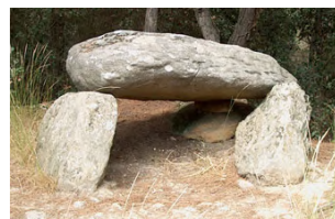
Dolmen de Can Planes

Els monuments que es troben en aquest tram són: de can Planes a Sant Bartomeu