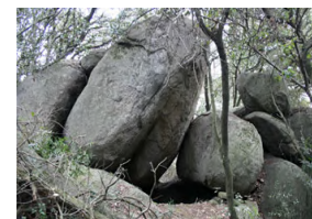
Pedra de l'escorpí